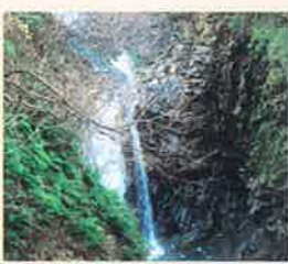
鮎返りの滝 MAP P2-F 大山滝つり橋の真下にある滝。清流・加勢川を昇ってきた鮎が、その流れの激しさから上流にはいけず、返ったことが滝の名前の由来になっています。