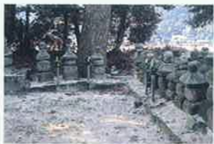
転法輪寺古墓群 MAP P3-D 町指定保護文化財 別宮は空也上人入滅の地と伝えられ、上人塚といわれる墓の周辺に、鎌倉時代から江戸時代初期の五輪塔、宝篋印塔が約百基群在する貴重な古石塔群です。