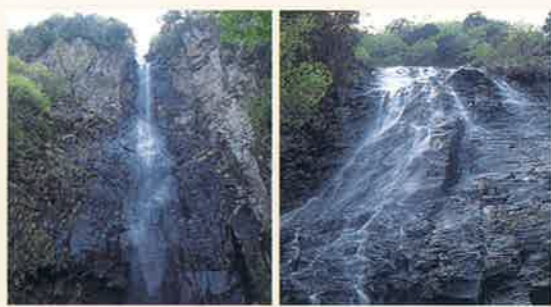
千丈滝(左:雄滝 右:雌滝) MAP P2-D 船上山東側山腹一帯の高さ60m~100mの切り立った溶岩壁(屏風岩)の岩場から轟音激しく流れ落ちる、雄(おん)滝と雌(めん)滝があります。