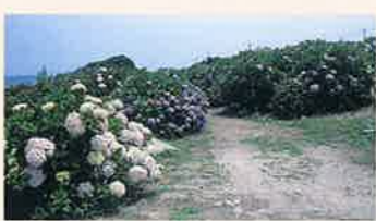
達東あじさい公園 MAP P3-A 琴浦町の東の海岸部に達東の浜と呼び、この海岸に自生していたあじさいを地元の人々が大切にしながら増やし続け、見事な公園となりました。6月中旬頃から7月なかばまで2000本の色とりどりのあじさいが咲き誇ります。