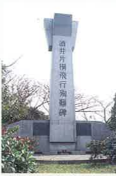
酒井・片桐飛行殉難碑・八橋城跡 MAP P3-A 八橋城跡(町指定保護文化財)にある、この飛行殉難碑は千歳空港開港の礎といわれる酒井飛行士が、1932年(昭和7)片桐機関士と朝日新聞社機で日清議定書調印の模様を空輸中に八橋沖での遭難・殉難を悼み建立された碑。