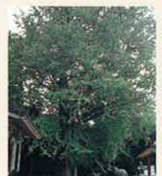
転法輪寺の大イチョウ MAP P3-D 県指定天然記念物 転法輪寺の本堂に向かって右手にある大イチョウで、この木の落葉は農家には冬を告げるものとして親しまれています。樹高約29m、幹周り約5m、枝長約22m。