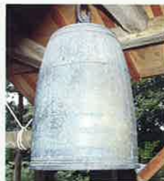
智積寺の梵鐘 MAP P2-B 県指定保護文化財 智積寺は室町末期の1530年(享禄3)に船上山頂に創建されたが、戦国時代の混乱により江戸時代前期に解散。大正時代にゆかりの寺が再び智積寺と名を現在に至っています。この梵鐘は1347年(貞和3)の銘があり、元は備前の寺にあったもの。