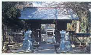
方見神社・木造隨身像 MAP P3-B 方見神社は、もと上伊勢皇大神宮と称され平安時代から続くといわれる由緒ある神社。隨身門には、それぞれ武者の形をした奇木造の隨身像(神域を守る像)(県指定保護文化財)が安置されています。鎌倉時代の作といわれ本格的なもの。