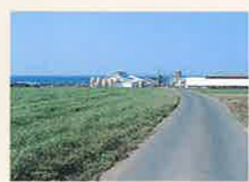
県畜産試験場 MAP P3-A 家畜改良センター鳥取牧場の東に位置し、昭和4年に開設され、肉用牛や飼料の改良・研究などを行っています。牧草地を主とした敷地は26haにもおよび、船上山や大山、日本海などの眺めが素晴らしい。