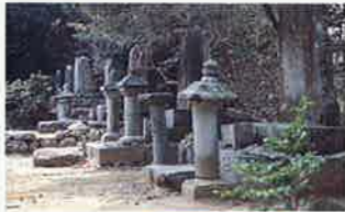
津田家墓所 MAP P2-1 町指定保護文化財 八橋の体玄寺にある、江戸時代の池田侯の治世下で、八橋に陣屋を置いて藩主からこの地域の政治を任せられた藩士正治を行った、津田氏代々の墓所。11基の墓碑があり往事を偲ばせる立派なもの。