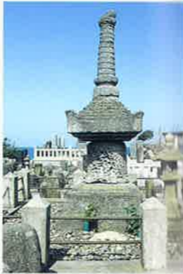
赤碓塔と花見淵墓地 MAP P3-A 県指定保護文化財 鎌倉末期の作で、安山岩製・高さ約3mの宝塔様式と宝篋印塔の二様式を持つこの塔は、赤碓付近にしか見られないことから、赤碓塔と名付けられました。西日本最大級の自然発生墓地の花見淵墓地の一角にあります。