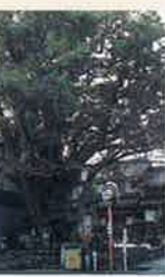
前田氏の大タブ MAP P2-1 町指定天然記念物 イヌグスと同種でタブと称されています。村の二度の大火を防ぎ、盆踊りの会場になるなど信仰が厚い。樹高約15m、幹周り約6.7m。