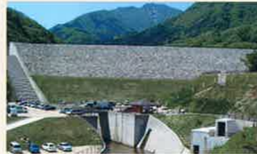
船上山ダム MAP P2-D 平成16年3月に竣工したロックフィル式の灌漑用ダムで受益面積約950ha。湖面には船上山の雄姿がうつり、麓の万本桜公園とともに絶好の散策地となりました。