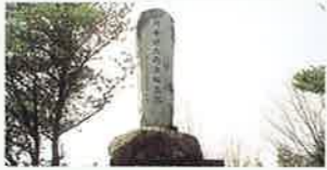
川合清丸先生誕生地の碑 MAP P2-1 翁田川中流西岸の山頂にある、郷土が生んだ思想家、宗教家の川合清丸先生誕生地の碑。川合清丸先生はこの地に生まれ、1888年(明治21)に幕末の三府である山岡鉄舟を社長に迎え国教大道社を創立しました。この碑文は先生の教えを受けた林鏡十郎元首相による揮毫。