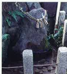
天皇水 MAP P2-C 因伯の名水 後醍醐天皇が京都へ還行の折、大岩を指差され「この岩を起こせば水が湧いて出る」と言われたところその通り清水が湧いて出たという伝説の地「天皇水」には今も清水が湧き出ています。