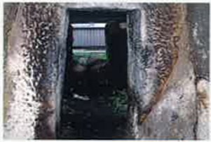
出上岩屋古墳 MAP P2-1 県指定保護文化財 大型の横穴式石室が露出。石室の入口の玄門は一枚岩をくり貫いたもの。遺体を収めた玄室からは金メッキの耳飾りが出土。古墳時代後期の築造と考えられます。