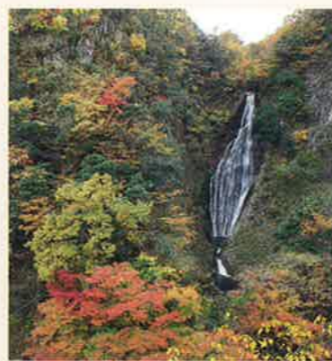
鱒返りの滝 MAP P2-D 両側は絶壁、その高さや滝壺の深さを知る者はいないという神秘的滝。滝見台から見たこの一枚岩深谷は、四季の彩に飛沫が映え絵のように美しい。