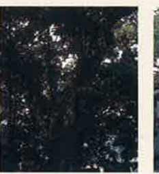
ダイヌグス MAP P3-D 県指定天然記念物 空也上人塚といわれるところがあり、「空也上人いさぎの木」と伝えられています。イヌグスはクスノキ科の常緑高木でタブの木とも言われ、この地方ではハネリとも呼ばれています。樹高約15m、幹周り約4.7m、枝長約20m。