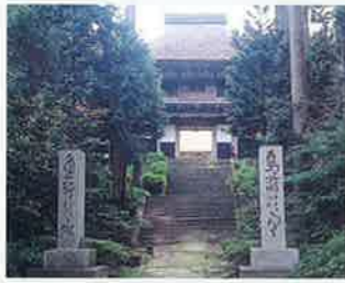
木造阿弥陀如来像 (永福寺) MAP P2-1 町指定保護文化財 高く伸びた杉の老木に囲まれた参道の正面に石段があり、その上に簡素で美しい茅葺屋根の山門が建っています。