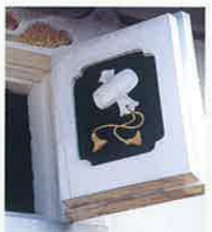
光の鏡絵 MAP P2-A 光集落の家々の蔵には、地元左官職人が漆喰壁に鏡で描いた福神や動植物の浮き彫り(鏡絵)が多く施されています。これらは昭和30年代から縁起と家構を重んじる意味で描かれるようになり、それぞれは精緻で落ちついた集落のたたずまいを引き立たせています。