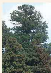
古布庄の大スギ MAP P3-E 県指定天然記念物 大正神社のご神木として親しまれてきた大杉で、樹高約35m、幹周り約7m、枝長約19m。