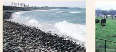
鳴石の浜 MAP P2-3-A 琴浦の海岸は、石ころの浜も長く、なかでも、下市の海岸では特に冬のおおしげの日に打ち寄せた波で石がこすれあい、ごろごろという音が聞かれます。このような現象は全国的にも珍しいもの。ここは、いい音が立つことで県内外のサーファーにもよく知られています。