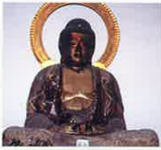
木造阿弥陀如来像 (永福寺) MAP P2-1 町指定保護文化財 永福寺に安置される客仏で、もとは船上山の寺にあったものと伝えられています。平安時代中期の作と言われ、当時の船上山の栄華を伝える貴重な遺品。