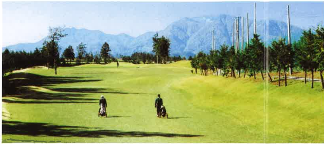
No.11 280ヤード・パー4 大山に向かってナイスショット