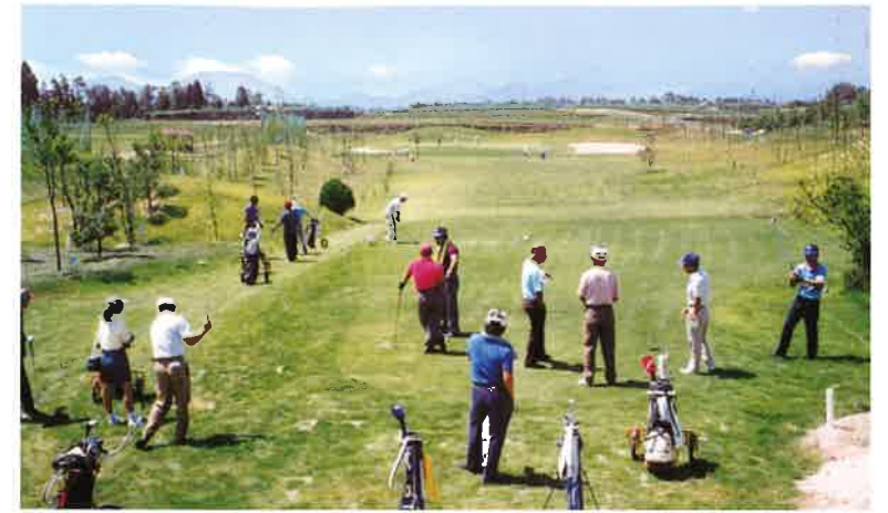
No.1 168ヤード・パー3 ティグラウンドよりグリーンを望む