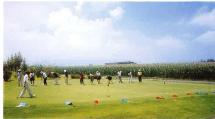
ゴルフ教室レッスン風景(受講料無料)