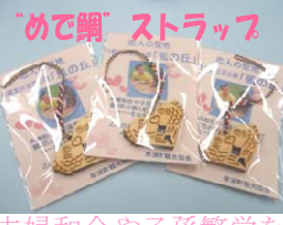
夫婦和合や子孫繁栄を願って鯛2匹の腹と腹を向き合わせハートをかたどりしました。

丘の恋人の聖地認定 開催される恋人の聖地認定 国の観光地として ポツポツと魅力が たじろぎつつある 活性化を図るため トンネルの除幕式 予定の抽選会 まじりに、観覧 イマズン、浦合 ベトトトラ、お 方、先着五名 風の丘に、け 信し、ていけ す。のた 。新ら 。とな 思、い まを