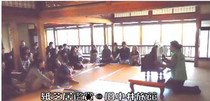
紙芝居鑑賞 @ 旧中井旅館