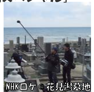
NHKロケ @ 花見湯墓地

縁結びの国につぼん ～列島縦断パワースポットの旅～ 1月3日(月)18時～(BSH)