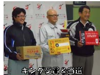
キング受賞&当選 おめでとうございます!!