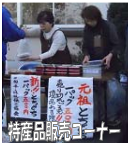
特産品販売コーナー