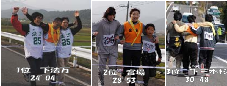
1位 下法万 24' 04