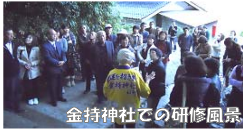
金持神社での研修風景