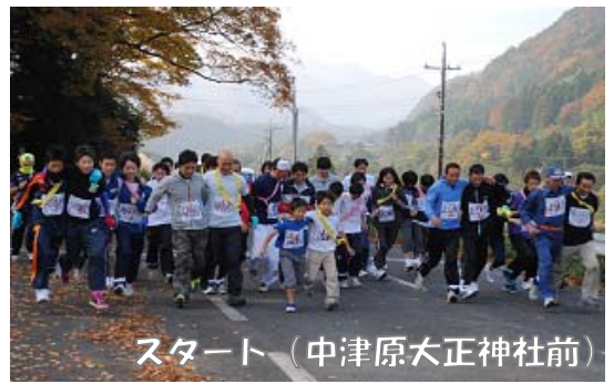
スタート（中津原大正神社前）