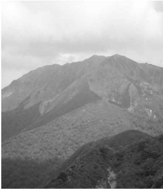
「烏ヶ山から大山を望む」