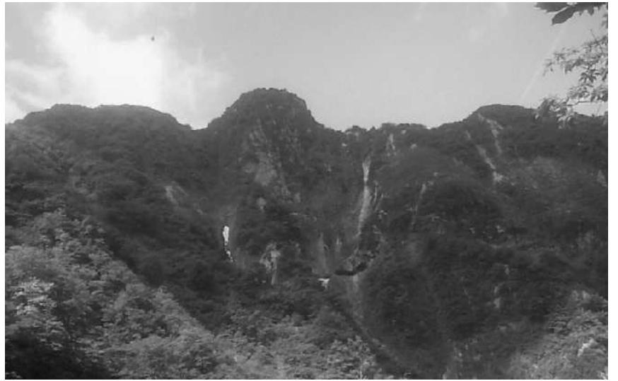
琴浦町の最高峰「烏ヶ山」