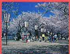
船上山万本桜公園