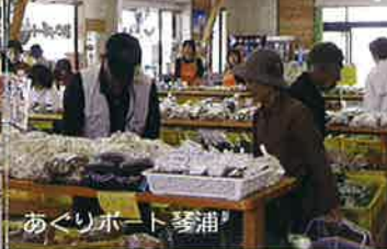
あくりポート琴浦